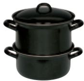
Kartoffelkocher mit Emaildeckel

Enamel cookware suitable for all stoves and ovens: induction, ceramic, elektro, gas oven. Scratch resistant, Dishwasher compatible. Easy to clean, Recommended for allergy of nickel.