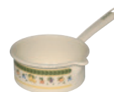
Stielkasserolle mit großem Ausguß