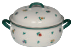
Kasserolle mit Deckel