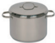
Hoher Topf mit Deckel

Quality 18/10 stainless steel cookware. Extra thick forged thermo capsule bottom. Excellent heat conduction, distribution and retention. Suitable for all heat sources: induction, ceramic, electric, oven. Easy to clean, mix'n match, stackable.