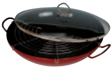
Wok komplett, Stahlglasur

Enamel cookware suitable for all stoves and ovens: induction, ceramic, elektro, gas oven. Scratch resistant, dishwasher compatible. Easy to clean, recommended for allergy of nickel.