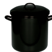
Vorratstopf mit Deckel schwarz