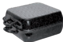
Bratpfanne mit Deckel