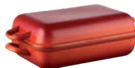
Bratpfanne mit Deckel