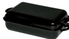
Bratpfanne mit Deckel