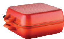
Bratpfanne mit Deckel