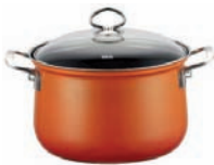
Fleischtopf mit Glasdeckel

Enamel cookware with heavy bottom and rustproof pouring rim. Guaranteed to heat food quickly. Suitable for all heat sources, especially induction, ceramic, electric, gas and oven. Easy to clean. Recommended for people with nickel allergies.