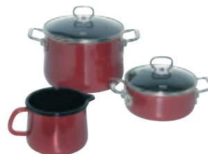
Starter Set 3-tlg.