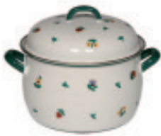
Fleischtopf mit Deckel

Rounded, high-quality enamel cookware with thick heat-retaining steel bottom and rustproof flared pouring rim goes well with Gmundner ceramic sets. Guaranteed to heat food quickly. Suitable for all heat sources: induction, electric, gas, oven. Easy to clean. Recommended for people with nickel allergies.