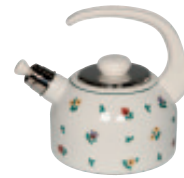
Wasserkessel mit Flöte