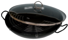
Wok komplett, Stahlglasur