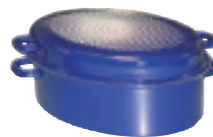
Gänsebräter oval mit Deckel