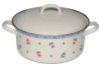
Kasserolle mit Deckel