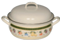
Kasserolle mit Deckel