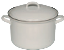
Fleischtopf mit Deckel

Enamel cookware with lip or rustproof pouring rim. Guaranteed to heat food quickly. Suitable for all heat sources, especially induction, ceramic, electric, gas and oven. Easy to clean. Recommended for people with nickel allergies.