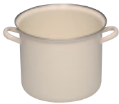
Topf mit Chromrand