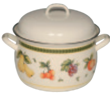
Fleischtopf mit Deckel

Enamel cookware with strong bottom. Enamel cookware suitable for all stoves and ovens: induction, ceramic, elektro, gas oven. Scratch resistant, dishwasher compatible. Easy to clean, recommended for allergy of nickel.