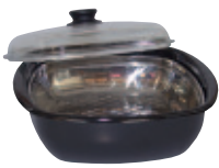
Dampfgarer 3tlg. mit Glasdeckel und Gareinsatz