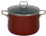
Fleischtopf mit Glasdeckel

Enamel cookware with extra thick heat-retaining steel bottom. Guaranteed to heat food quickly. Suitable for all heat sources, especially induction, ceramic, electric, gas and oven. Easy to clean. Recommended for people with nickel allergies.