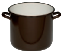
Topf mit Bördel