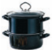
Universaldämpfer mit Glasdeckel