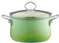
Fleischtopf mit Glasdeckel

Enamel cookware with heavy bottom and rustproof pouring rim. Guaranteed to heat food quickly. Suitable for all heat sources, especially induction, ceramic, electric, gas and oven. Easy to clean. Recommended for people with nickel allergies.