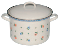
Fleischtopf mit Deckel

Enamel cookware with heavy bottom and rustproof pouring rim. Guaranteed to heat food quickly. Suitable for all heat sources, especially induction, ceramic, electric, gas and oven. Easy to clean. Recommended for people with nickel allergies.